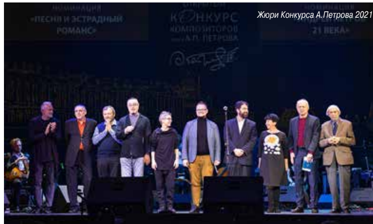
Жюри Конкурса А.Петрова 2021