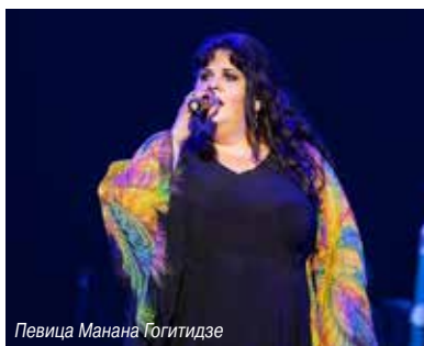
Певица Манана Гогитидзе