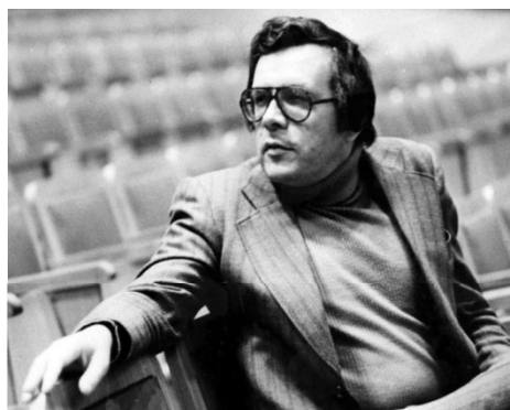
Композитор Андрей Петров.