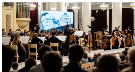
Финальный тур в Большом зале Санкт-Петербургской филармонии им. Д.Д. Шостаковича.