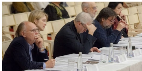
Жюри конкурса композиторов имени А.П. Петрова. Финальный тур в Большом зале Санкт-Петербургской филармонии им. Д.Д. Шостаковича.