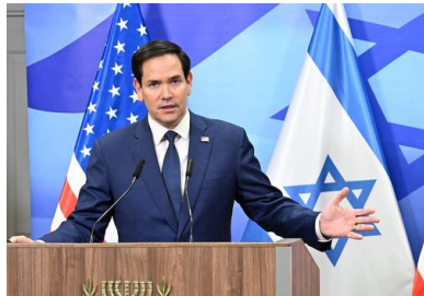
Марко Рубио.

Госсекретарь США Марко Рубио в интервью CBS News дал высокую оценку контактам США и России, состоявшимся в последнее время, — в частности, встрече российского лидера