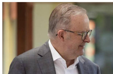
Премьер-министр Австралии Энтони Альбанезе

Канберра присоединилась к «коалиции желающих», подтвердив готовность отправить своих военнослужащих в числе миротворцев на Украину.