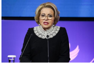
Валентина Матвиенко.

Вести речь о европейской безопасности без участия России и Белоруссии нереально. Об этом в интервью телеканалу «Беларусь-1» заявила спикер Совета Федерации Валентина