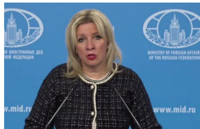
Мария Захарова. Скриншот видео.

16 марта 2025, 23:05 Источник: ТГ-канал Марии Захаровой