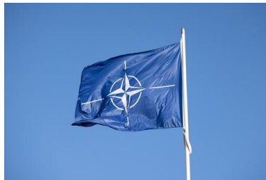
Флаг НАТО, FinnishGovernment / Wikimedia Commons

17 марта 2025, 06:54 Источник: «Известия»