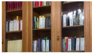
Фестиваль «День Дома»