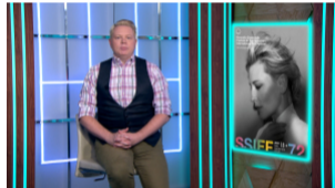
Третий сезон «Триггера», криминальная драмеда «Фарма» и телепроект о закулисье...