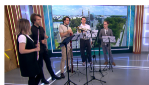
Петербургский духовой квинтет покорил международный музыкальный олимп