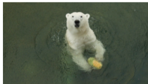
В зоопарке встречают осень с дарами. Лакомства питомцам от петербуржцев