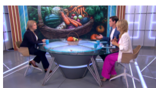
Как продать свой урожай на законных основаниях?