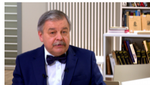
Обратите внимание. Имя композитора Василия Соловьёва-Седого на карте...