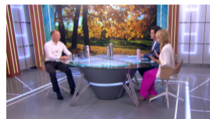
Чай для осенних прогулок. Как правильно заваривать в термосе?