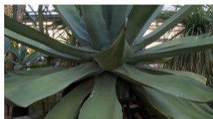
История спасения старейшей агавы Ботанического сада