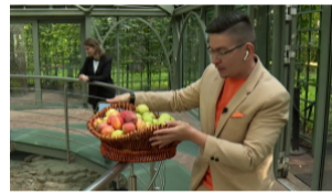
Фестиваль фонтанов в Летнем саду